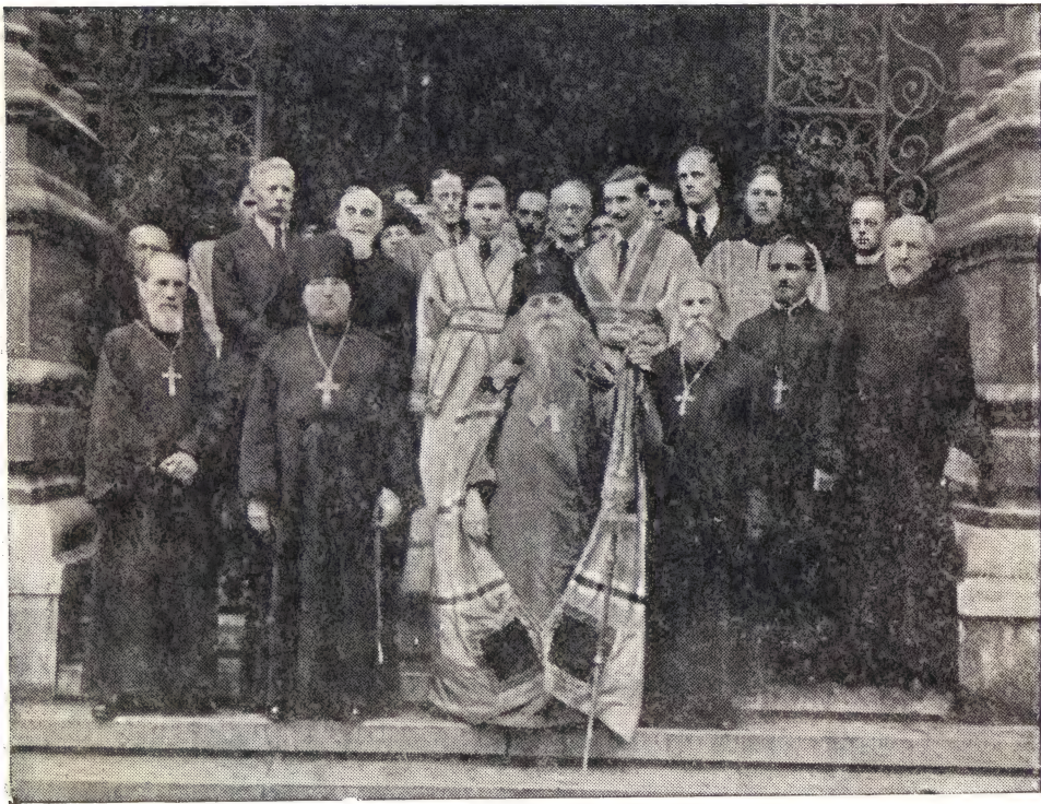
Высокопреосвященный Сергей, архиепископ Берлинский и Германский, на праздновании юбилея русского Свято-Николаевского собора в г. Вене

4/17 апреля исполнилось 50 лет со дня освящения русского Свято-Николаевского собора (б. посольской церкви) в г. Вене, столице Австрии. Празднование этого юбилея было приурочено к храмовому празд-